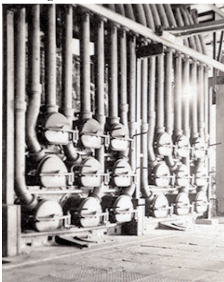
Figura 1. Hornos de retortas horizontales de la fábrica de gas de Mataró, circa 1945