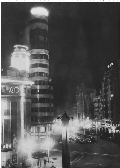
Figura 5 La Gran Vía de Madrid de noche, 1935

Los medios de comunicación de masas, la prensa, en primer lugar, la radiodifusión, posteriormente, la publicidad y los nuevos sistemas de comercialización y venta, unido al abaratamiento de los precios de los productos, por la mejora de los sistemas de comunicaciones y la progresiva entrada de la producción en masa, facilitaron la irrupción de los nuevos artículos de consumo, y los cambios en los modos de vida, usos y costumbres de los habitantes de las ciudades. A ello coadyuvó el cine con su poder de fascinación y socialización de los nuevos estilos de vida y sistemas de valores (Rodríguez Martín, 2007a y 2007b, 2008). El ocio nocturno y el deporte, como práctica y espectáculo de masas, se fueron extendiendo a sectores cada vez más amplios de la sociedad urbana. El ritmo de vida de las ciudades se aceleró, las avenidas principales se llenaron de paseantes, curiosos y consumidores atraídos por las luces de neón de los nuevos comercios y espectáculos, ávidos de las novedades que les ofrecía el gran escaparate en el que se habían convertido los centros de las grandes ciudades. Las calles se poblaron de los fascinantes cartelones de los estrenos cinematográficos, y los espectadores irrumpieron en masa en las oscuras salas para contemplar las nuevas estrellas del firmamento del celuloide (Otero Carvajal, 2016 y 2018, Rodríguez Martín, 2019c).