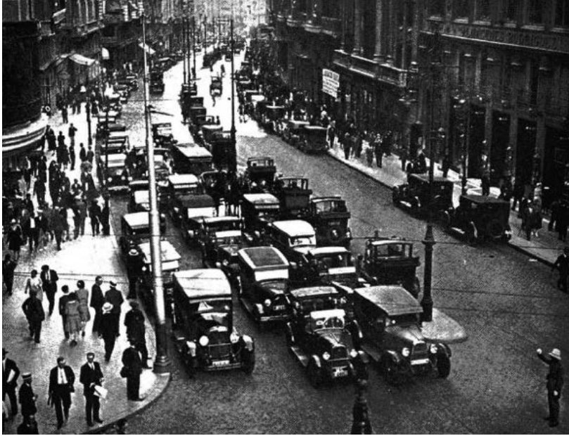
Figura 3 Gran Vía de Madrid, 1929