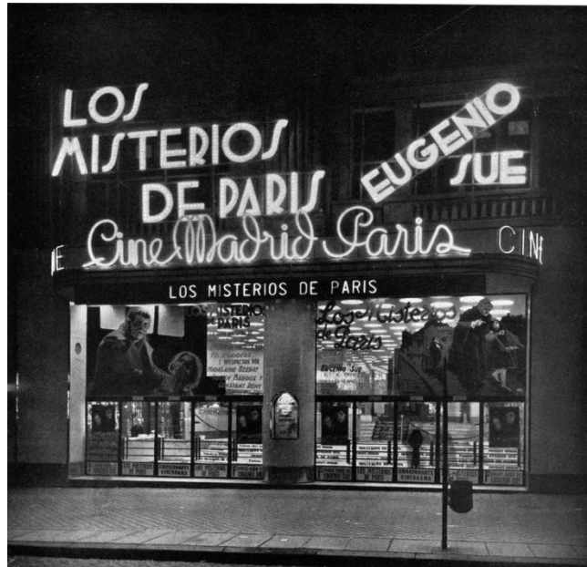
Figura 6 Fachada del Cine Madrid-París, calle Gran Vía, Madrid, 1935.