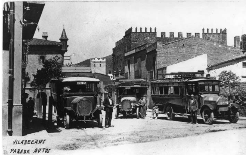
Figura 2 Línea autobús Gavà-Barcelona, años 20