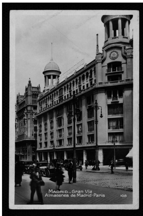
Figura 7 Fachada de los Almacenes Madrid-París, calle Gran Vía (Madrid), circa 1930