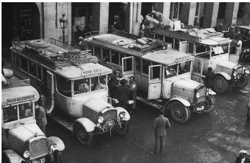
Figuras 1 Autobuses en la Plaza Mayor de Madrid, 1932.