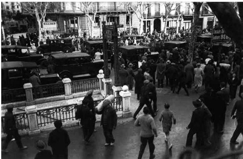
Figura 4 Paseo de Gracia de Barcelona, 1934